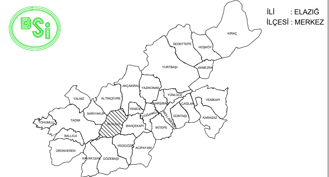
ELAZIĞ MERKEZ AT VE TİGH PROJESİ KUYULU KÖYÜ KISMİ TOPLULAŞTIRMA PARSELASYON HARİTASI