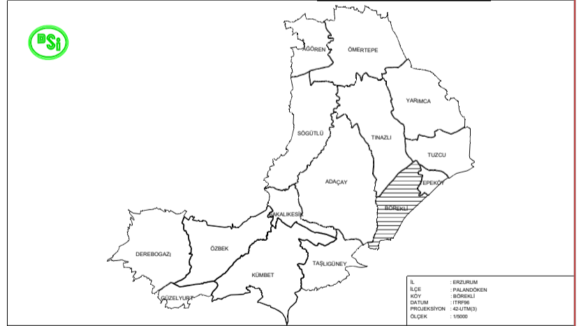
SAKALIKESİK OVASI A.T ve T.I.G.H PROJESİ BÖREKLİ MAHALLESİ 3.ASKI PARSELASYON HARİTASI