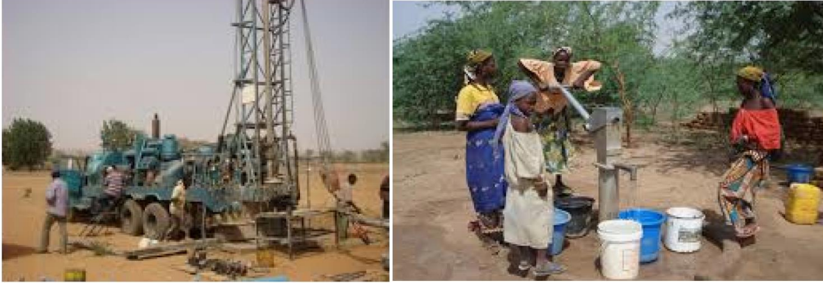
Şekil 2: Su sıkıntısının çok ciddi boyutlara ulaştığı, binlerce insanın temiz suya ulaşamadığı, kişi başı su kullanımının dünya ortalamasının dörtte biri olduğu Afrika'da DSİ tarafından yapılan çalışmalarla, kıta ülkelerine içme ve kullanma suyu ulaştırılmış olup bu sayede DSİ hizmetlerini ülke sınırları dışında da sürdürmektedir.

Çeşitli kullanım amaçlarına yönelik tahsis edilen yeraltısuyu miktarı 17,03 milyar m 3 tür. Bu miktarın %67 si sulama, % 24 ü içme-kullanma ve % 9 u sanayi amaçlı olarak tahsis edilmiştir.