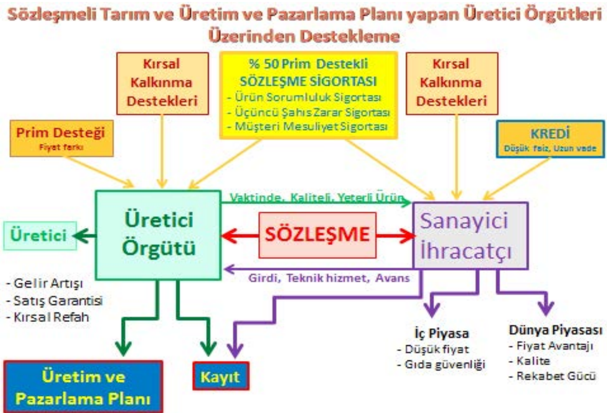
Şekil 2. Üretici örgütleri Üzerinden Destekleme Modeli