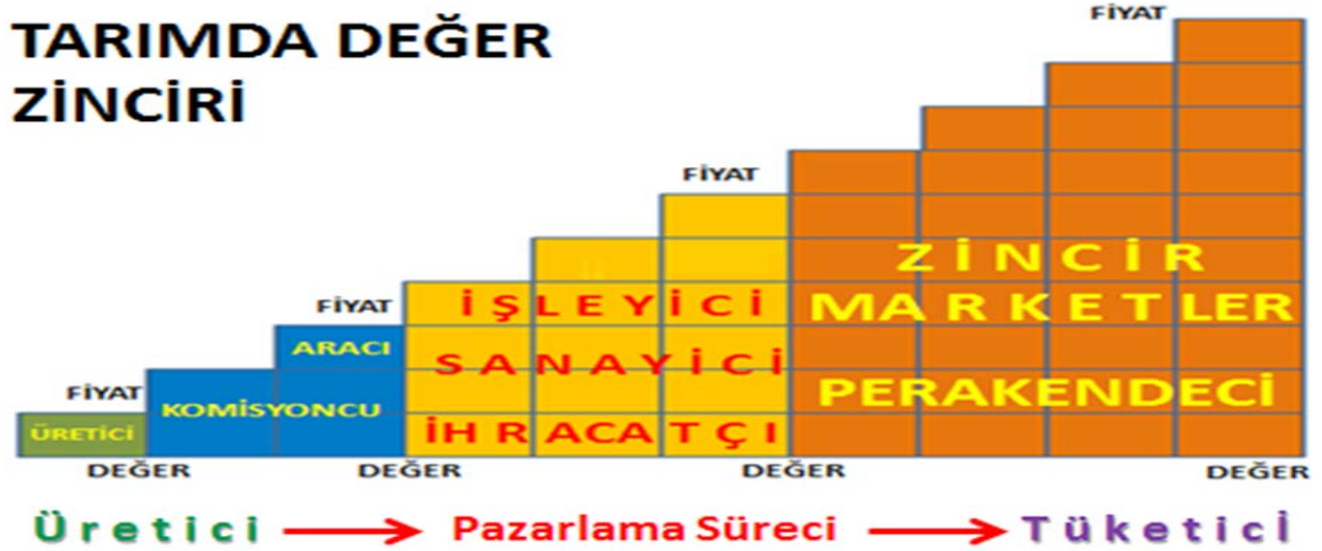
Şekil 3. Tarımda değer zinciri

Görüldüğü üzere, tarım piyasalarında üreticiden tüketiciye kadar birçok ara kademe devreye girmektedir. Her basamakta değer artmakta ve bunun bir fiyatı olmaktadır. Üretilen toplam değer sonunda elde edilen toplam gelirin paylaşımında en küçük pay şekilde görüldüğü üzere üreticiye kalmaktadır. Toplam gelirden alınan pay tüketiciye doğru gittikçe artmaktadır. Çiftçinin özellikle de küçük aile çiftçisinin tek başına bu sistem içinde hak ettiği geliri kazanabilmesi zordur. Piyasada uygun fiyatı bulabilmeleri, üretimlerini yönlendirebilmeleri, standartlara uyabilmeleri ve alıcılar karşısında güçlü olabilmeleri için kendi örgütleri altında birleşmek, sürekli devinim ve değişim içinde bulunmak zorundadırlar. Üretici örgütleri, üreticinin piyasada rekabet gücünü artırıcı ve pazar imkânlarını geliştirici bir güce sahiptir. Üretici örgütleri piyasada pazarlama, nakliye, paketlenme, işleme gibi faaliyetlerde bulunursa; üreticinin oluşan değerden aldığı payı kendiliğinden artacaktır. Hatta ucuz girdi ve finans tedarik ederek, üretimi talebe göre planlayarak, işleyerek, depolayarak, sözleşmeler yaparak, gerektiğinde piyasalara müdahalelerde bulunarak ortağına piyasada rekabet şansı yaratacak, yeni pazarlara ulaşabilmesini sağlayacaktır. Bu durumda üretici ile tüketici arasında yer alan birçok aracı tarafından verilen hizmet üretici örgütü tarafından daha hızlı ve ucuza yapılacağı için maliyetler ve tüketiciye yansıyan fiyatlar da azalacaktır.