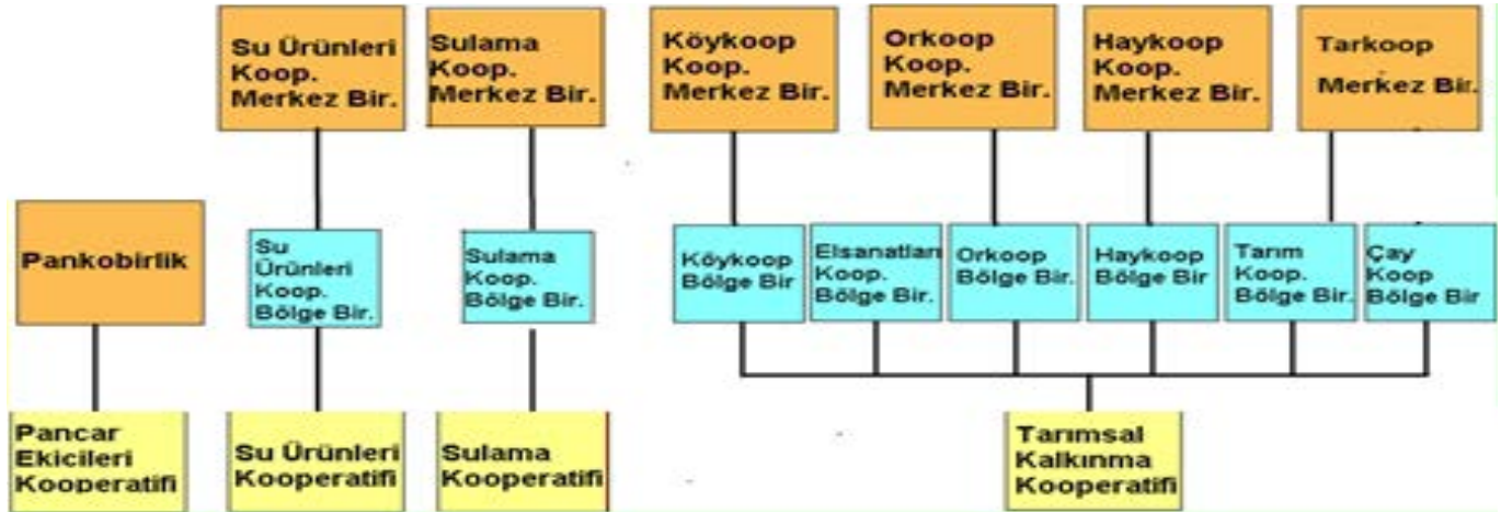
Tablo 2. Tarım ve Orman Bakanlığı bünyesindeki tarımsal kooperatiflerin dikey yapılanması ve sayısal dağılımı

Kooperatifçiliğin temel kanunu olan 1163 sayılı Kooperatifler Kanunu kapsamında tarım sektöründe faaliyet gösteren kooperatifler 2 bakanlık altında bulunmaktadır. Tarım ve Orman Bakanlığı bünyesinde, Tarımsal Kalkınma Kooperatifleri, Sulama Kooperatifleri, Su Ürünleri Kooperatifleri ve Pancar Kooperatifleri; Ticaret Bakanlığı bünyesinde ise Yaş Meyve Sebze Kooperatifleri ile Üretim ve Pazarlama Kooperatifleri kurulmaktadır.